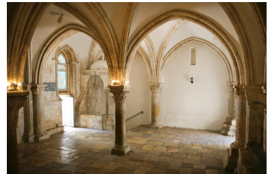
Le Cénacle à Jérusalem.

la bonne nouvelle du Salut ; jusqu'à l'Ascension de Jésus, ils attendaient le Règne de Dieu pour eux (Cf. Ac 1, 6), maintenant ils sont impatients d'aller annoncer la Parole jusqu'aux extrémités de la terre ; avant, ils n'avaient presque jamais parlé en public, maintenant ils parlent à tous avec conviction.