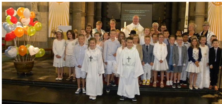
35 enfants de l'Unité Pastorale ont reçu le sacrement de l'eucharistie pour la première fois.